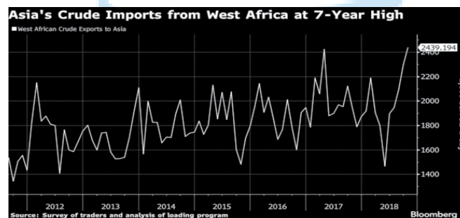
نمودار شماره ۳: واردات نفت چین از آفریقا

در احتمال دوم از این سناریو، با قطع واردات نفت از آمریکا، چین همین مقدار را از سایر کانال‌های انتقال نفت در خاورمیانه و آفریقا تامین خواهد کرد. در چهارچوب این احتمال، طبق گزارش‌های بازار انرژی جهان، واردات نفت چین از آفریقا در طول سال‌های گذشته و به‌طور خاص با افزایش بحران جنگ اقتصادی افزایش یافته است (نمودار شماره ۳).